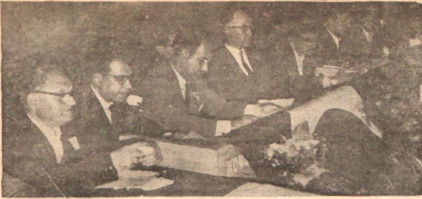
Açık oturumda konuşan hatiplerin bir kısmı..

Atatürkçülük açısından memleket gerçeğine bakmak lüzumunu duymuş, düşünce ve gerçeğin yol kavşağında Atatürkçülüğü Atatürkçülükle sosyalizmin, memleketi kurtarmak konusunda birleştiğini görmüşlerdir.