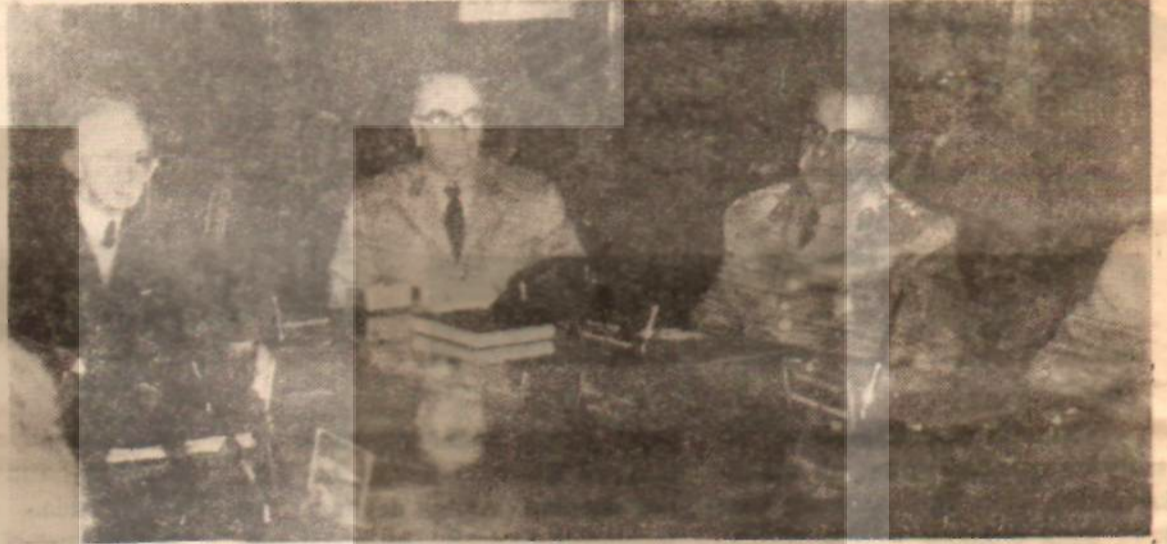
Başbakan İnönü, kurulda Orgeneral Sunay ile.