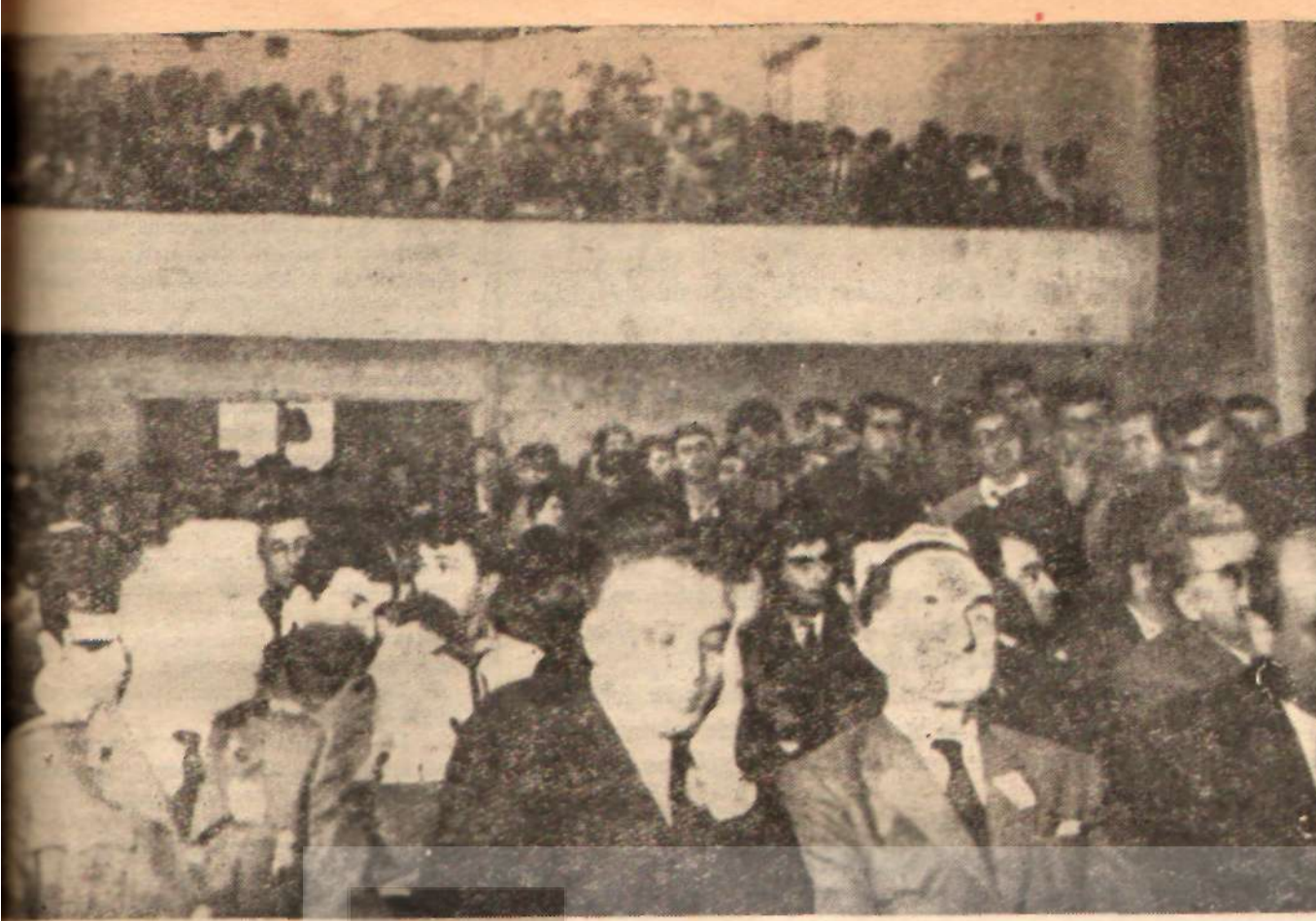
Sosyalist Kültür Derneğinin MTTB. lokalinde yapılan açık oturumunun dinleyicileri

...sordur. Sosyalist Kültür Derneği, bu kuşağımızın en ağır sorumluluğu bu hizmet yolunda, aydınlar arasında işbirliği kurulmasını sağlamak adına gütmetedir.